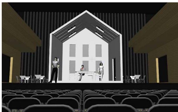
> Scénographie Docteur Miracle