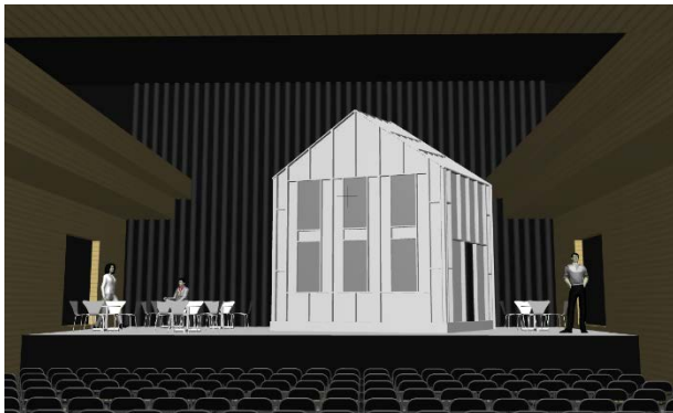
> Scénographie Rita

Dans Rita , les spectateurs verront le côté « face » de la scénographie : la maison sera utilisée comme façade et comme volume structurant l'espace de la terrasse. Elle pourra également être utilisée comme loge. Durant Docteur Miracle , les spectateurs découvriront le côté « pile » de la scénographie : un intérieur domestique. Dans cette œuvre, la maison sera ouverte à la manière d'une maison de poupée géante. C'est durant l'entracte, que l'élément scénographique monumental sera déplacé et retourné. Idéalement, ce moment, a vue du public depuis le balcon, devra être chorégraphié.