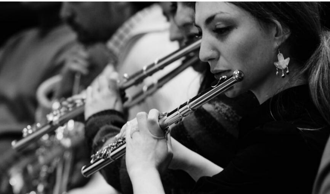
Orchestre Mahler