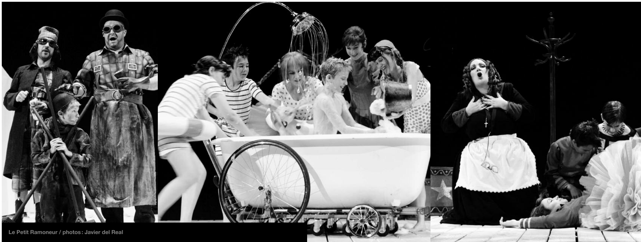
Le Petit Ramoneur

«Cette pièce convient parfaitement aux voix des enfants, la mélodie tonale est souple, le texte rimé rythmé et coloré, est particulièrement bien traduit en français.»