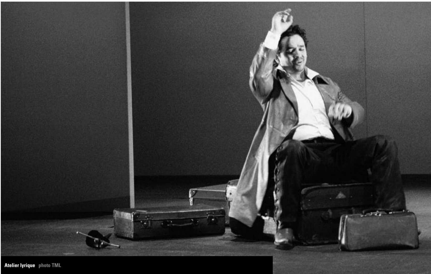
Atelier lyrique

Comment résumer cette première année d'activité à la direction du Conservatoire?